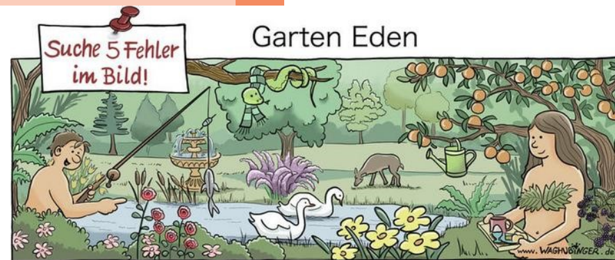
Angel, Springbrunnen, Schal, Gießkanne, Tablett