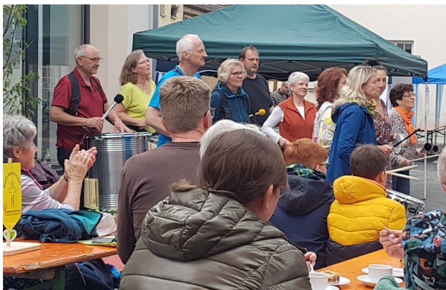
Percussion auf dem Kirchenplatz.