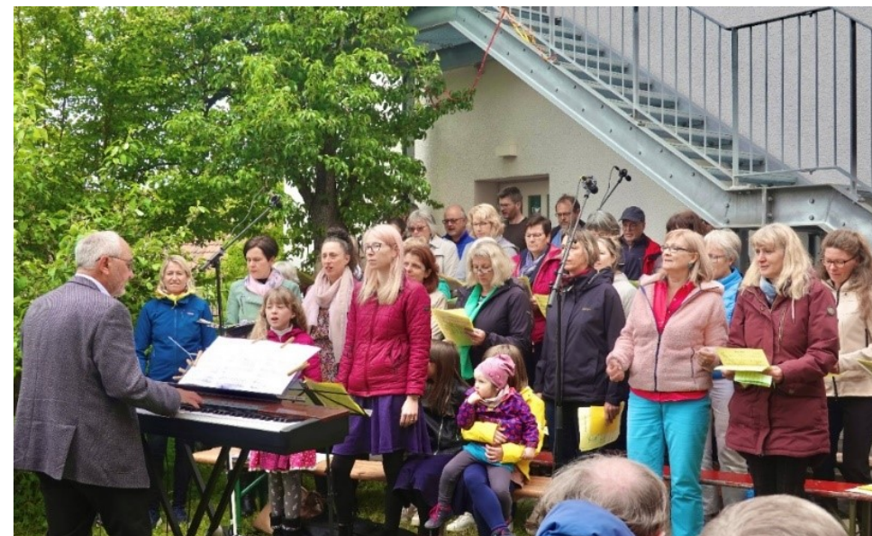
Der Chor ImPuls zu hören beim Gottesdienst im Pfarrgarten.