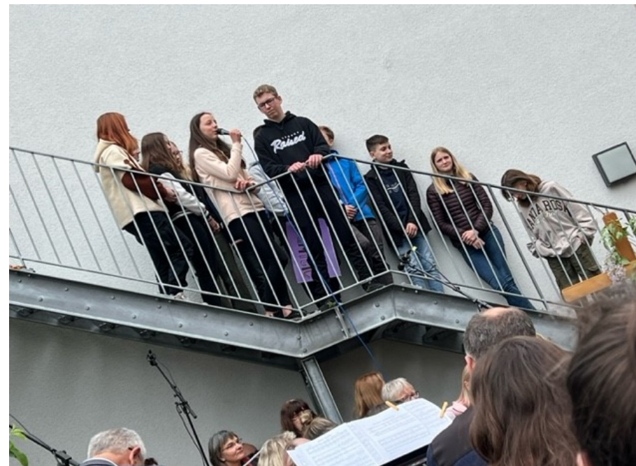
Die Konfis mit beeindruckender Performance im Gottesdienst.