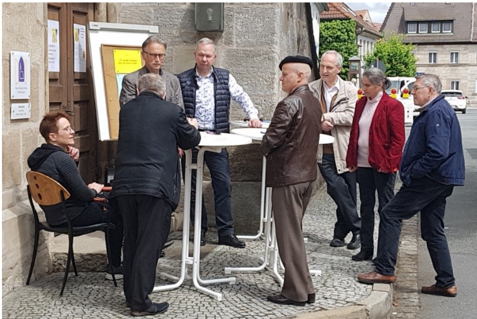
Talk an der Kirchentür zu Fragen der Zeit.